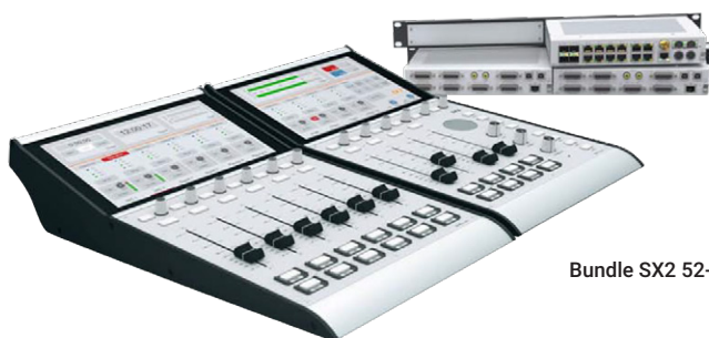
Bundle SX2 52-1999